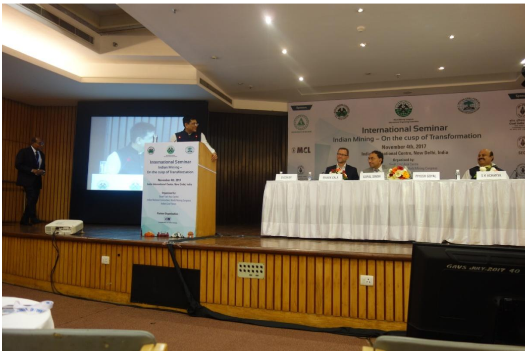
Na mównicy Minister Rządu Indii pan Piyush Goyal, a w prezydium seminarium „Górnictwo Indii – na zakręcie transformacji” prezydent IOC WMC prof. Marek Cała.