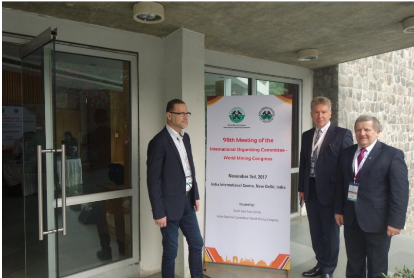
Polska reprezentacja przed obradami IOC w India International Centre

Polscy przedstawiciele w IOC zaprezentowali zagadnienie związane z obecnością metanu w kopalniach i badaniach skutków ewentualnego jego wybuchu. Wystąpienie zawierało pokaz krótkich filmów nagranych w Kopalni Doświadczalnej Barbara – w GIG-u ukazujących skutki eksplozji metanu w wyrobisku korytarzowym. Pokaz wzbudził olbrzymie zainteresowanie wśród uczestników seminarium.