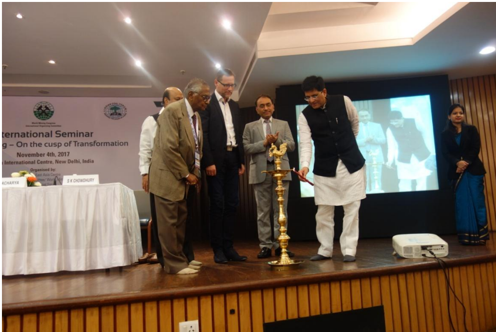
Minister Piyush Goyal wraz z członkami prezydium seminarium zapala symboliczną w Indiach lampkę towarzyszącą obradom konferencji.